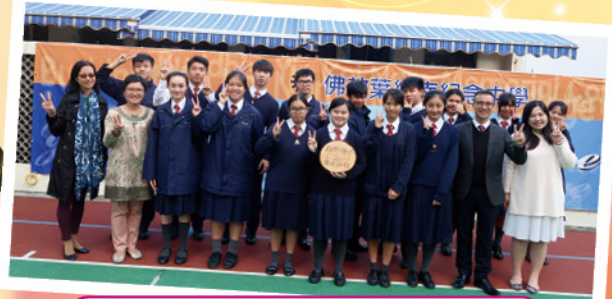
2017-18 年度朋輩調解員與校長合照