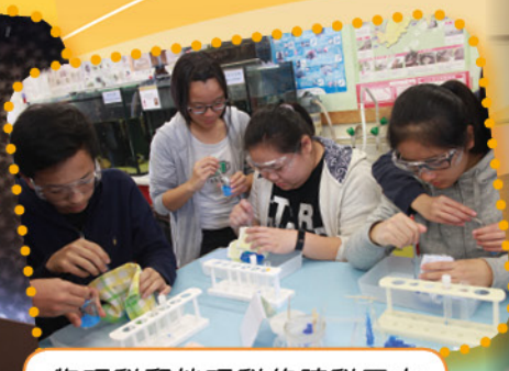
物理科和地理科的跨科天文環境教育營