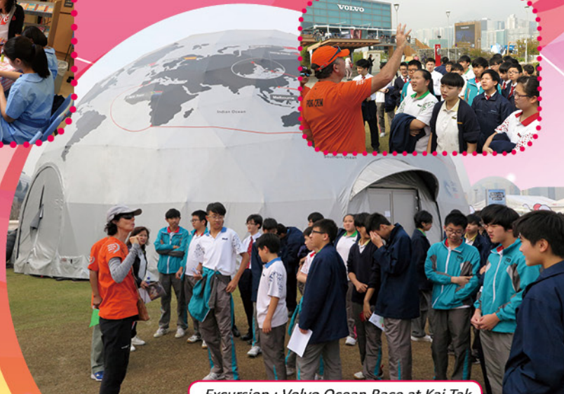
Excursion : Volvo Ocean Race at Kai Tak