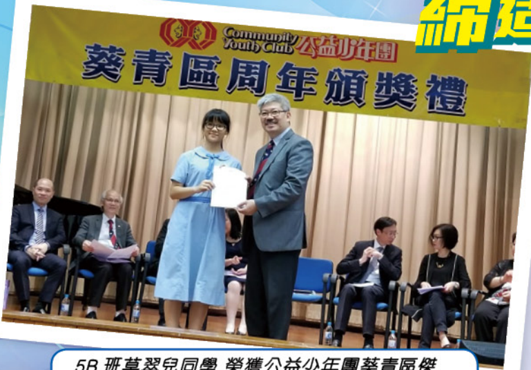
5B 班莫翠兒同學 榮獲公益少年團葵青區傑出團員，並代表香港前往日本交流

本校著重透過多元化的活動，培育學生成為「青年領袖」，讓學生從生活中發掘潛能，裝備自己，為將來投身社會工作做好準備。學校積極利用社區資源及人際網絡，讓學生投入社區服務，培養學生回饋社會、助己助人的精神，從而建立正確價值觀和更清晰的人生方向，讓學生及早為自己訂下未來的生涯規劃。憑著一腔熱忱，同學在不同社區活動及義工服務中屢獲殊榮，碩果累累，充份反映出社會各界對本校學生傑出表現的肯定和支持。