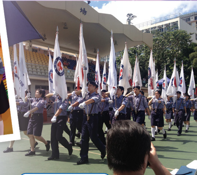
紅十字會聯合宣誓典禮