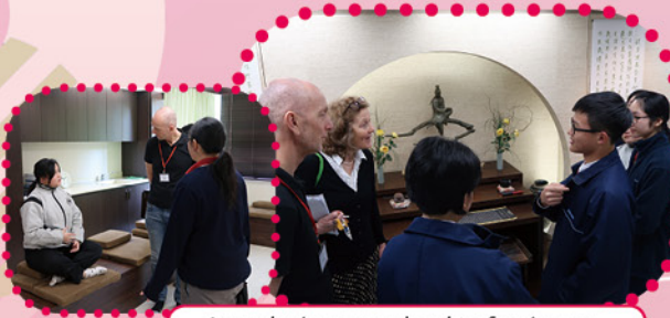
Introducing our school to foreigners