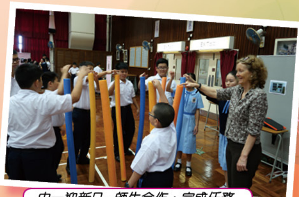
中一迎新日：師生合作，完成任務