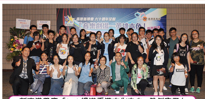
新來港學童「1+1 暢遊香港文化中心：戲劇欣賞」