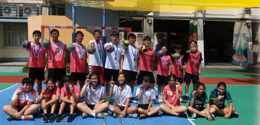
葵青區學界手球比賽男子甲乙組季軍及女子丙組殿軍