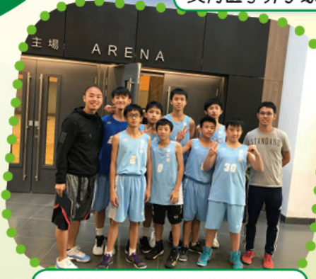
葵青區學界籃球比賽丙組季軍