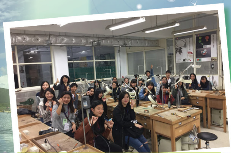
於台灣華梵大學體驗首飾設計系課程，並完成自己的作品