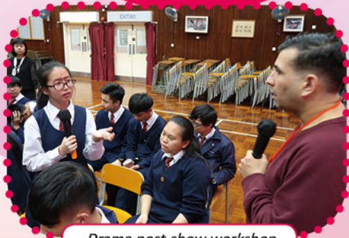
Drama post-show workshop