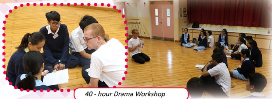
40 - hour Drama Workshop

Learning English in BYKNMC is not confined to the classroom. Here is a portal for our students to enter the world of English. Numerous diverse and exciting programmes are provided for our students. Not only do they learn the language, but also demonstrate what they have learnt.