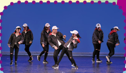
第 54 屆學校舞蹈節乙級獎