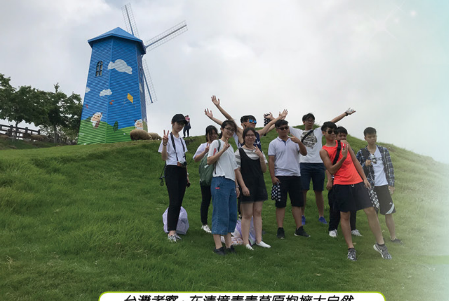
台灣考察：在清境青青草原擁抱大自然

本校致力爭取各方資源，資助學生境外學習，務求透過一連串交流活動，讓學生寓學習於娛樂，豐富自身閱歷。本校曾為學生造就了橫跨歐亞的遊學夢想，安排學生遊覽世界不同角落，留下的不僅是串串足跡，還有點滴回憶。國家諸如烏茲別克、俄羅斯、丹麥、日本、台灣等，均是交流團所至之地。學生見識異國風情，開啟世界視野；亦可參與內地大灣區考察，見證國家一日千里的發展。