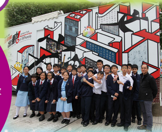
流動藝術館駐校活動