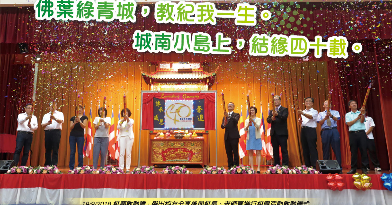
19/9/2018 校慶啟動禮：傑出校友分享後與校長、老師齊進行校慶活動啟動儀式