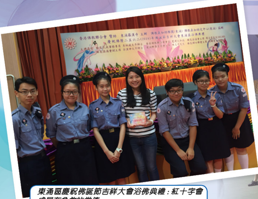
東涌區慶祝佛誕節吉祥大會浴佛典禮：紅十字會成員在急救站當值

本校著重透過多元化的活動，培育學生成為「青年領袖」，讓學生從生活中發掘潛能，裝備自己，為將來投身社會工作做好準備。學校積極利用社區資源及人際網絡，讓學生投入社區服務，培養學生回饋社會、助己助人的精神，從而建立正確價值觀和更清晰的人生方向，讓學生及早為自己訂下未來的生涯規劃。憑著一腔熱忱，同學在不同社區活動及義工服務中屢獲殊榮，碩果累累，充份反映出社會各界對本校學生傑出表現的肯定和支持。