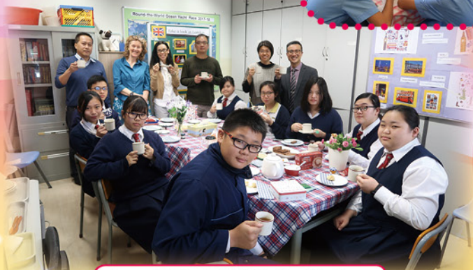
Fun activities held at the English Corner