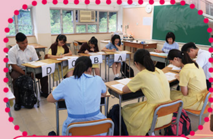
Joint-school Oral Practice : Preparing for HKDSE