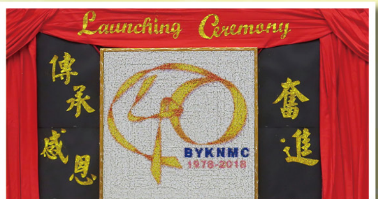
師生合力創作校慶標誌圖釘畫，並展示四十周年校慶主題