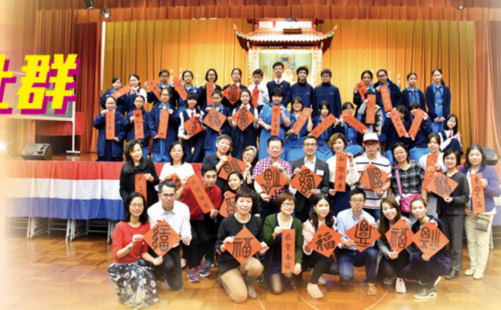
戊戌新歲賀耆康工作人員大合照