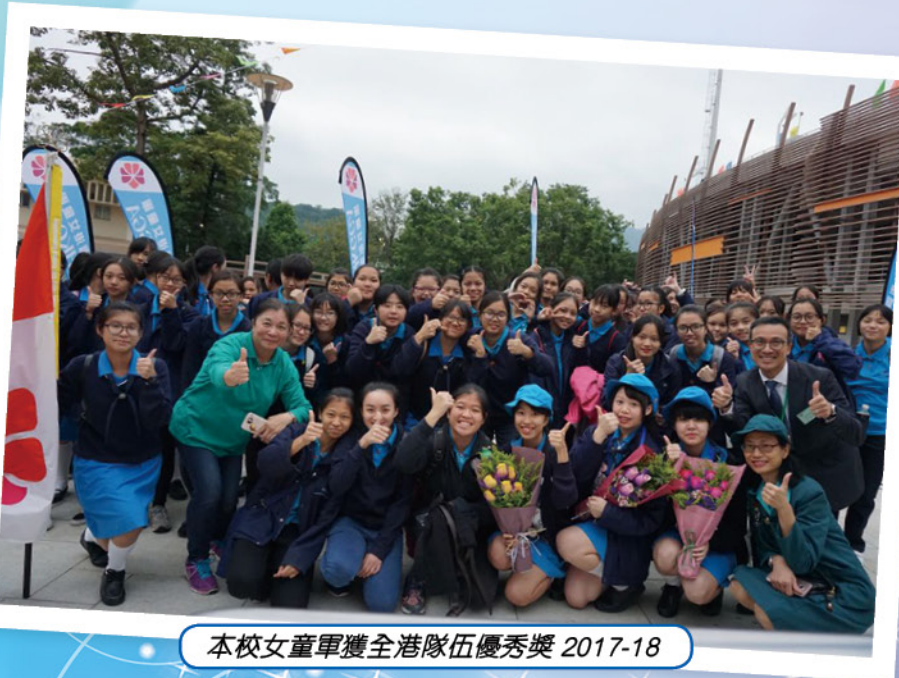
本校女童軍獲全港隊伍優秀獎 2017-18