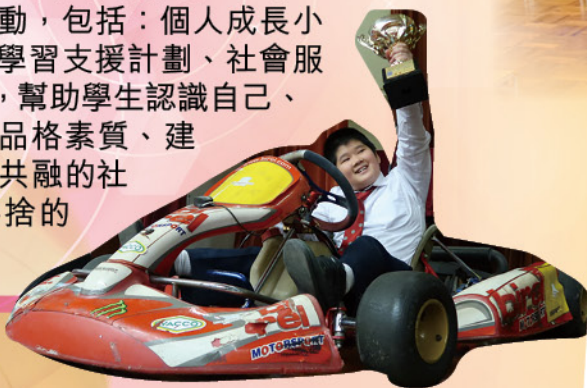
「人生方程式」專題講座

本著校訓「明智顯悲」的精神，校方致力培育學生積極正向人生觀，締造和諧社會。透過生命教育課及多元化活動，包括：個人成長小組訓練、班際比賽、學習支援計劃、社會服務及親子教育活動等，幫助學生認識自己、發掘個人潛能、提升品格素質、建立關愛的文化及和諧共融的社會，培養學生慈悲喜捨的精神。