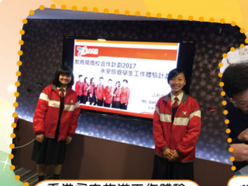
香港永安旅遊工作體驗計劃(教育局)