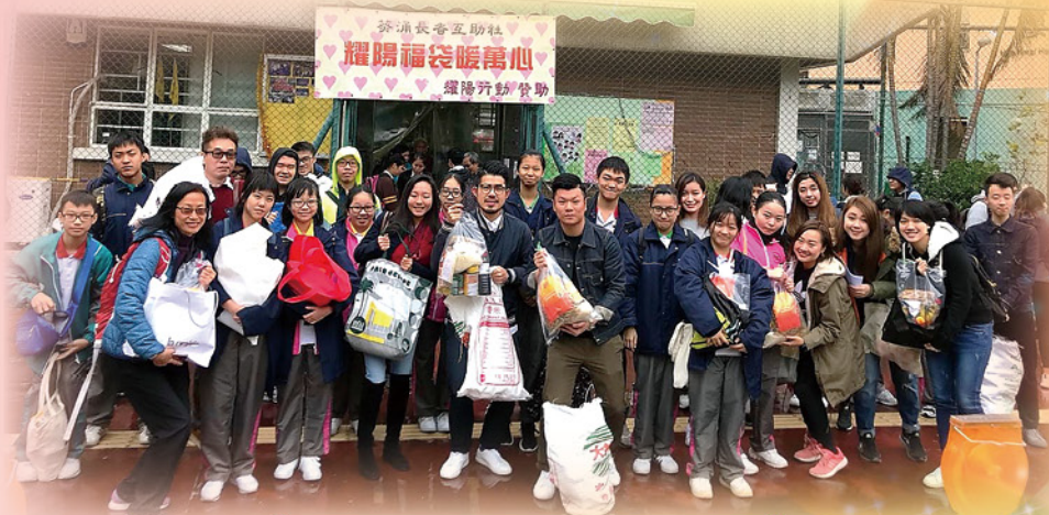
耀陽行動：探訪長者及派發福袋