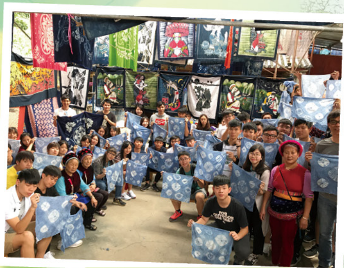
雲南考察：扎染體驗一人一作品