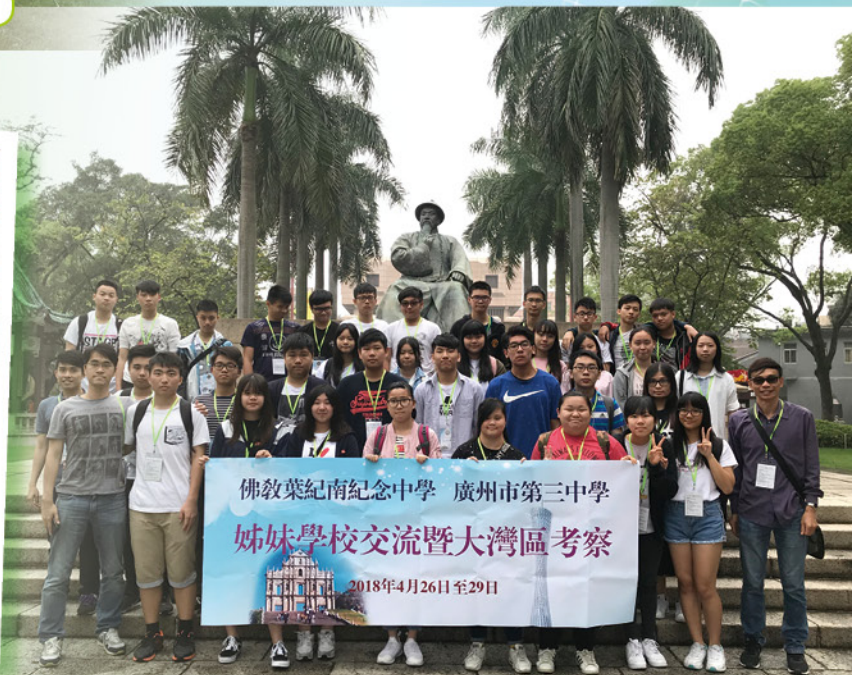
大灣區考察：參觀林則徐紀念館