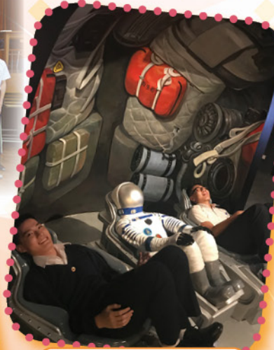
參觀太空館展覽廳