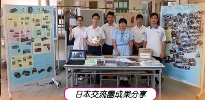
日本交流團成果分享