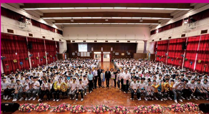
19/9/2018 校慶啟動禮：校長、老師及一眾嘉賓與學生大合照，並慶祝學校 40 周年校慶