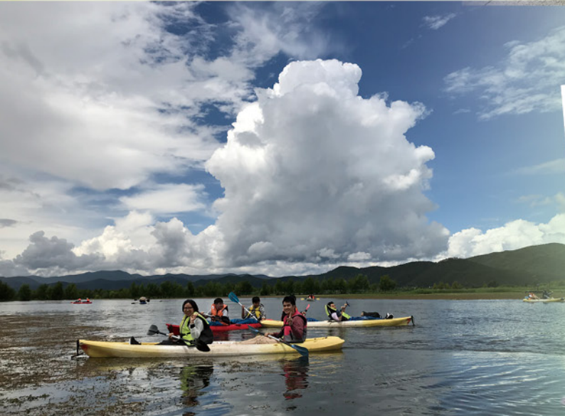
雲南考察：麗江拉市海划船