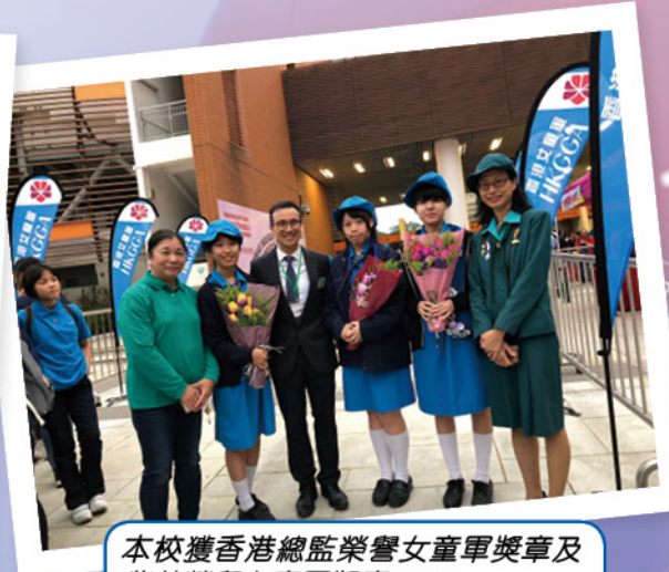
本校獲香港總監榮譽女童軍獎章及紫燕榮譽女童軍獎章 2018