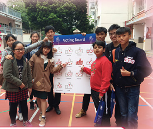
Excursion : International Cultural Fair