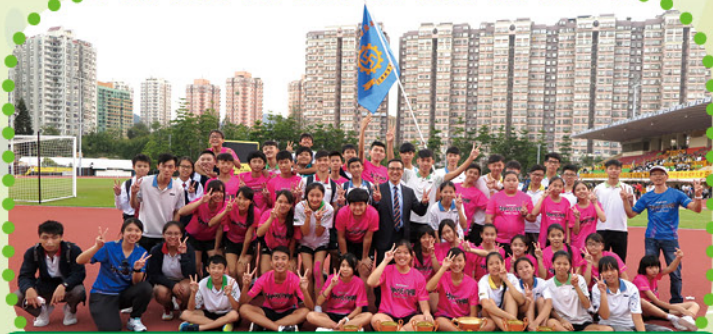
本校於全港佛教中學第二十七屆聯合運動大會奪得多個獎項