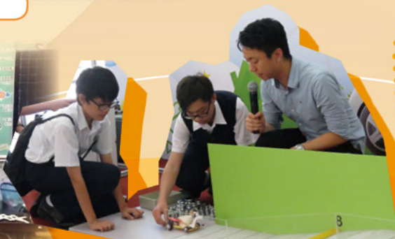
工程與初中生：太陽能充電車模型設計比賽