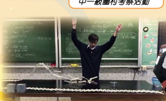
雪條棒炸彈 Stick Bomb