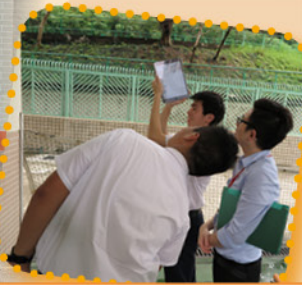
數學遊蹤：利用 iPad 量度建築物高度