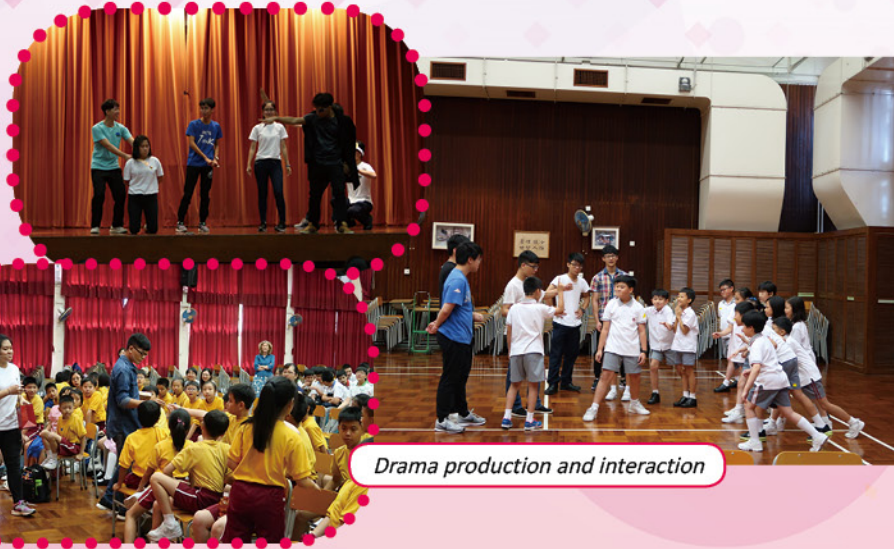
Drama production and interaction