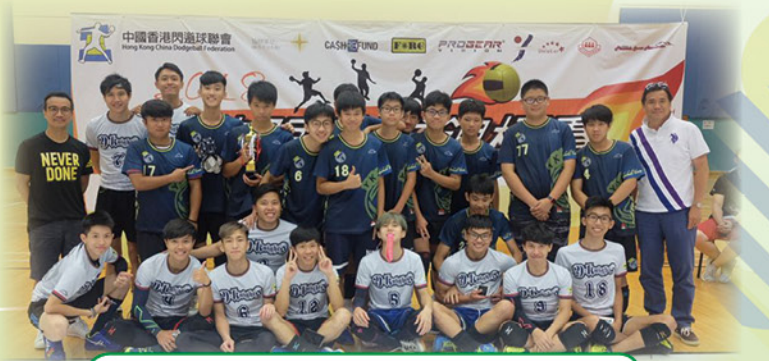
中國香港閃避球聯會 17-18 年度最強學校