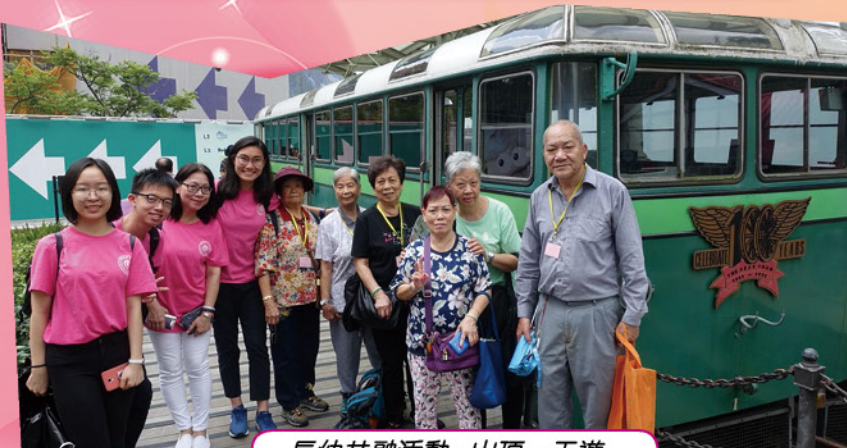
長幼共融活動：山頂一天遊