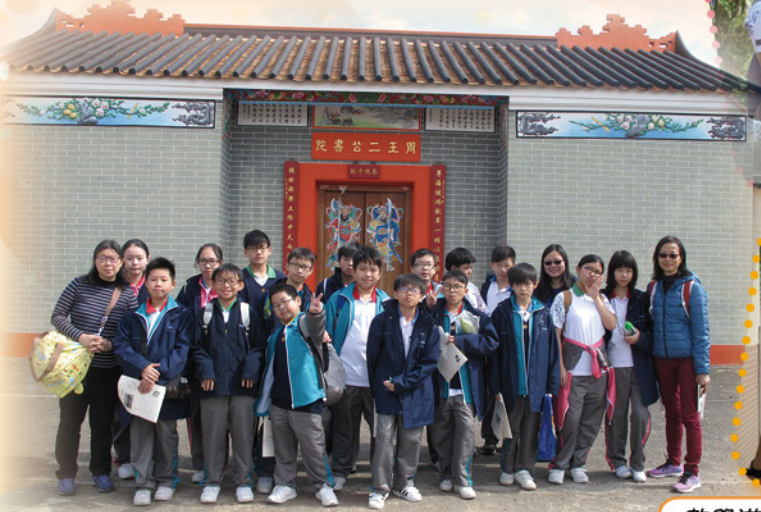
中一級圍村考察活動