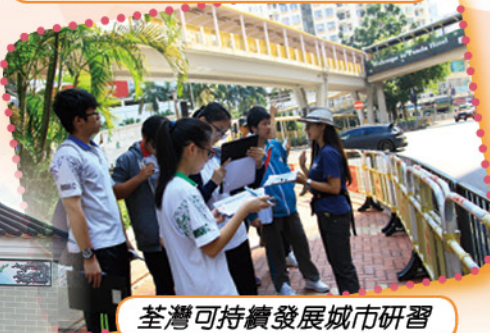
荃灣可持續發展城市研習